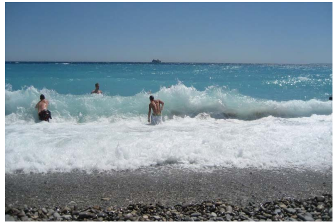
Erholung am Strand von Nizza

Natürlich nutzen wir jede freie Sekunde für eine kalte Erfrischung im Meer oder um die Stadt zu erkunden. Am vorletzten Abend gingen wir mit unseren Lehrern in ein Restaurant, um ein französisches Menü genießen zu können.