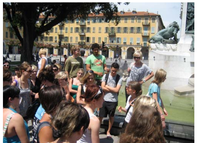
Stadtführung am Place Garibaldi in Monaco

Unser krönender Abschluss war der Aufenthalt in Monaco, den wir frei gestalten konnten.