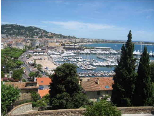
Blick auf Cannes