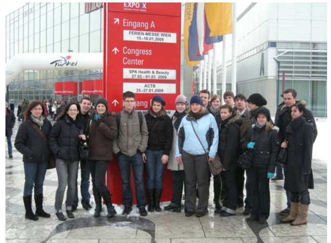
Die 4HB freut sich auf den Besuch der Ferienmesse Wien

Hauptziel war die Erkundung der Ferien-Messe, die mit rund 800 vertretenen Firmen aus 70 Ländern einen umfassenden Einblick in die Touristik ermöglichte. Die Teilnahme als Fachbesucher am gleichzeitig stattfindenden Fachkongress „Gut leben-grüner reisen“ stand ebenfalls am Exkursionsprogramm. Der touristische Horizont wurde noch mit einer „5-Sterne-Hotelsafari“ an der Wiener Ringstraße erweitert.