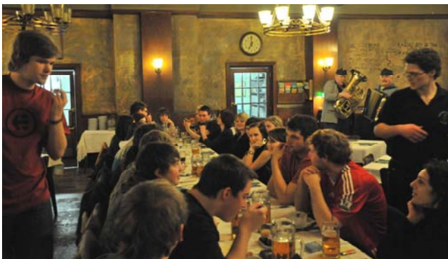
Gemütliches Beisammensein im Gasthaus zum Schwejk in Prag.

Die Analyse von Messeständen, der Besuch von Pressekonferenzen und Präsentationen rundeten das Arbeitsprogramm zur ITB ab. Gleichzeitig war es aber auch eine wunderbare Gelegenheit, ein Spiegelbild des Welt-Tourismusgeschehens zu betrachten, einen Eindruck von der gesamten Vielfalt des Reisens zu gewinnen und mit Menschen aus aller Welt in Kontakt zu treten.