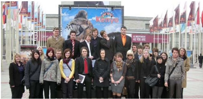
Erinnerungsbild vor der ITB in Berlin