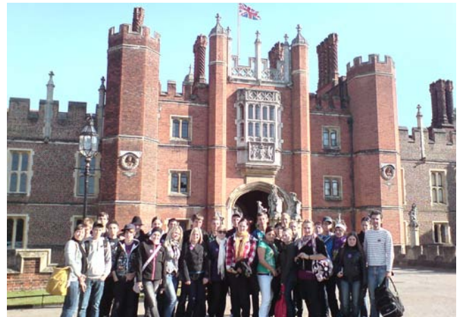
Hampton Court in London