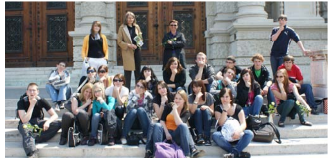
Gruppenfoto vor dem Kunsthistorischen Museum