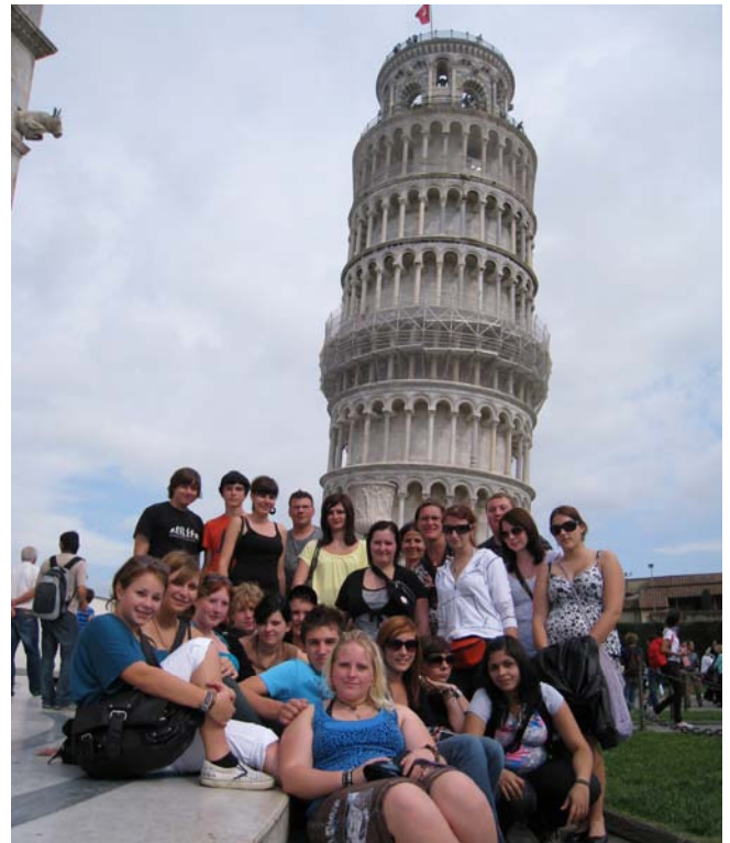
Gruppenfoto vor dem schiefen Turm von Pisa

Trotz unserer nahenden Rückreise in Richtung Heimat genossen wir auch noch den letzten Tag. Wir besuchten die