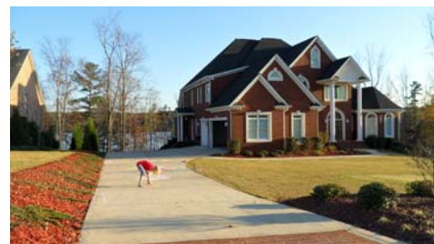
Haus in dem ich lebe

Ich bin nun schon seit September in Amerika im Bundesstaat Georgia, genauer gesagt Atlanta, wo ich als Demipair arbeite. Demipair bedeutet, ich gehe