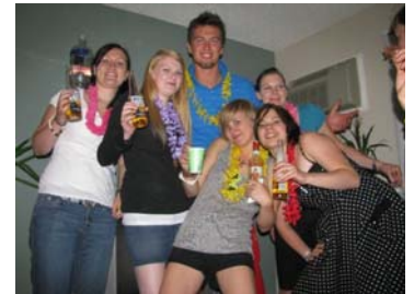
Party von Baletour-Absolvent/innen in Kalifornien

In unserer Freizeit sind wir mit den anderen Europäern viel gereist (Nationalparks an der Westküste, berühmte Städte wie z.B. San Francisco oder Tijuana, Destinationen wie Hawaii, Mexiko, Kanada, usw.) im Winter sind wir oft Snowboard gefahren im Lake Tahoe Schigebiet, im Sommer